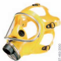
Dräger Panorama Nova EPDM RA